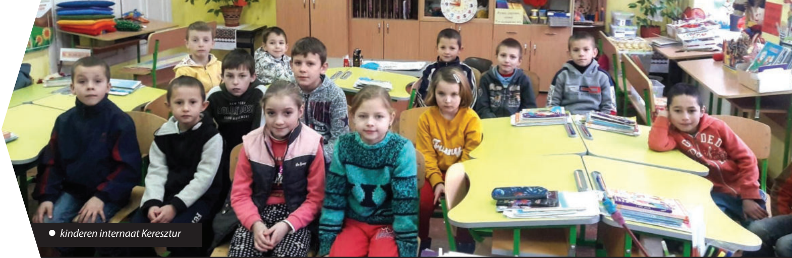
• kinderen internaat Keresztur