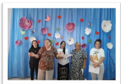
Moeders zingen van Gods schepping

We hebben kinderen gehad die nu volwassen zijn en hun eigen kinderen bij ons brengen en als ik ze vraag waarom ze voor ons hebben gekozen, is het antwoord dat ze zich hier bij ons 'gerespecteerd' voelden en dit is wat ze ook willen voor hun kinderen.