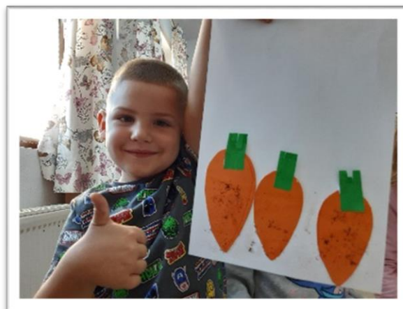
Leren over groente

Alle (28) kinderen die onze kleuterschoolactiviteiten bezocht hebben, hebben hele goede resultaten op de lagere school. Eveneens worden de ouders geïnstrueerd en is er een mentaliteitsverandering waar te nemen. Van vorige groepen zijn er 5 leraar geworden en 18 kinderen hebben de middelbare school afgerond. Daarnaast zijn er veel kinderen van ouders, die zelf op de kleuterschool hebben gezeten. De oud-leerlingen willen de goede opleiding, die ze zelf hebben gekregen, graag doorgeven aan hun kinderen. De belangrijkste impact is dat de kinderen weten dat God de Schepper is en dat Hij naar hen omziet.