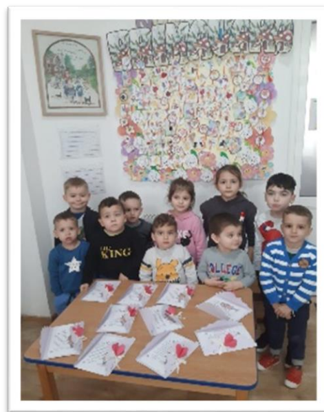
Kleuterklas in Casa Lumina