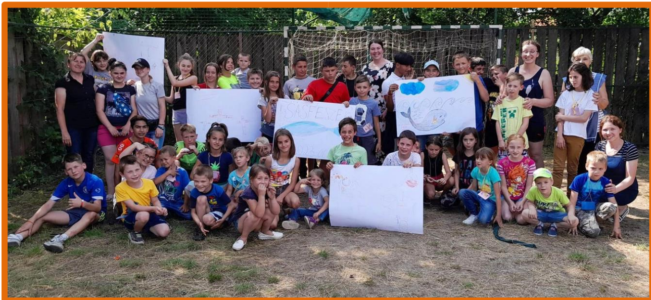
Zomerkamp 2023 groepsfoto

We zijn God dankbaar voor Zijn hulp in het moeilijke jaar 2023. Voor 2024 stellen we onze hoop ook op Hem en bidden we dat de oorlog zal eindigen.